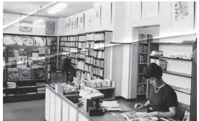
In der Bücherhalle, damals noch an der Veringstraße, vor rund 60 Jahren: Vorlesen (links), die Bibliothekarin bei der Arbeit (rechts).