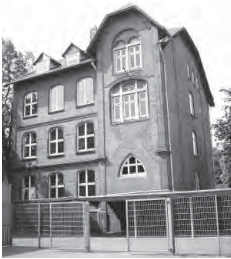
Auch das Künstlerhaus in der alten Schule Rahmwerder Straße in Georgswerder macht wieder mit.

KünstlerInnen von den Inseln laden wieder zum Schauen, Zuhören und Mitmachen ein