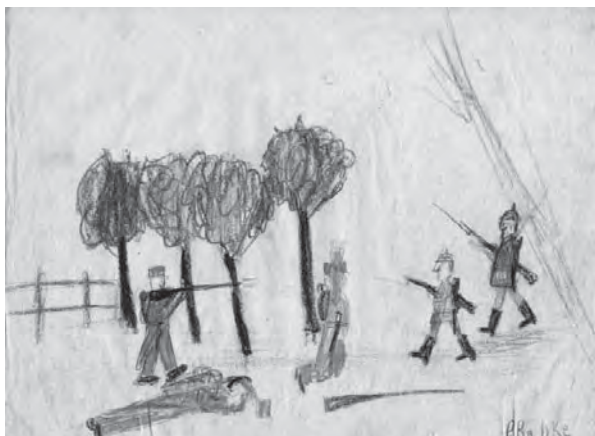
Kriegszeichnung eines Zweitklässlers, also circa 14-Jährigen, der damaligen Volksschule Fährstraße, um 1915/16.

Die Ausstellung „Kinder zeichnen den Krieg, 100 Jahre alte Kinderzeichnungen“ im Museum Elbinsel Wilhelmsburg wendet sich auch an Schulklassen