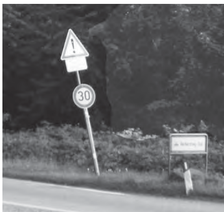
Hinter der Schmidt's Breite wird die Geschwindigkeitsbegrenzung auf 30 kmh noch einmal erneuert...