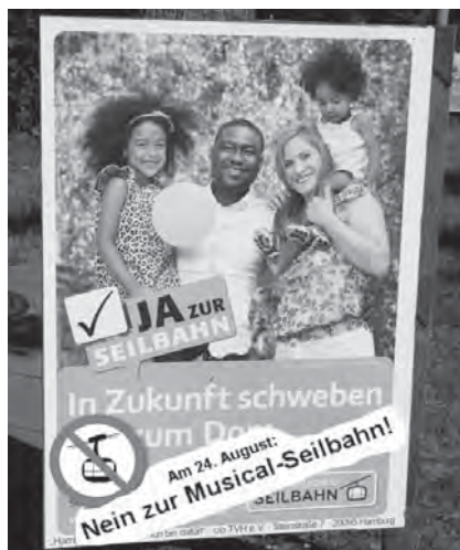
Seilbahn nein oder ja?

Massive Beeinflussung des Bürgerentscheids durch die Betreiberfirma