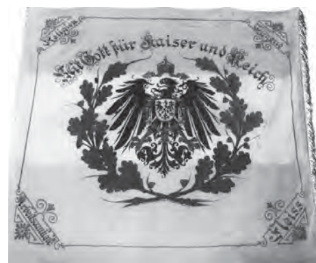
Rückseite des alten Banners der „Volksschule 1 Reiherstieg“ mit dem Wahlspruch „Mit Gott für Kaiser und Reich“ (über dem Reichsadler), in den Ecken die Begriffe Religion, Tugend, Arbeitsamkeit, Fleiß.