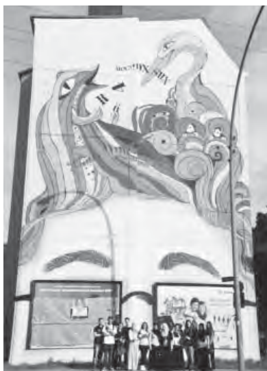
Die Klasse 9b vor ihrem Wandbild.

Die Klasse 9b der Stadtteilschule Wilhelmsburg arbeitete in luftiger Höhe an einem Wandbild