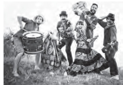
Soundattacke: Capitan Tifus.

20.30 h, Honigfabrik: In der Reihe Soundattacke: Capitan Tifus (Argentinien) - Fanfarria Latina. VVK: 8 € / AK: 10 €.