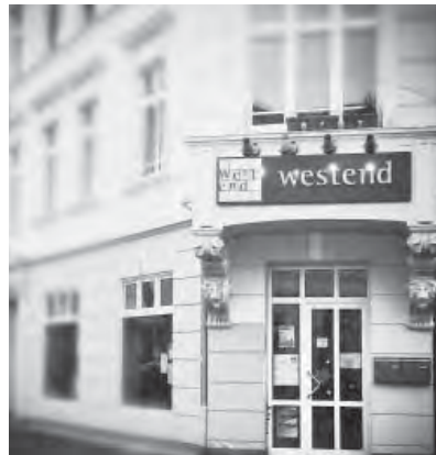
Der Nachbarschaftstreff westend im Vogelhüttendeich feiert seinen fünften Geburtstag.