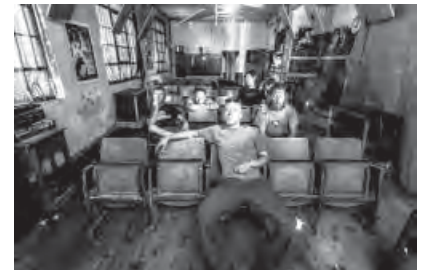
BudZillus: Ska bis zum letzten Hemd.

28 Clubs – 100 Bands – 50 Busse – 1 Ticket - VVK: 17 €/AK: 20 €. Und in der Honigfabrik kracht es richtig. Mit SURFITS – BUDZILLUS – SKAZKA Orchestra & After