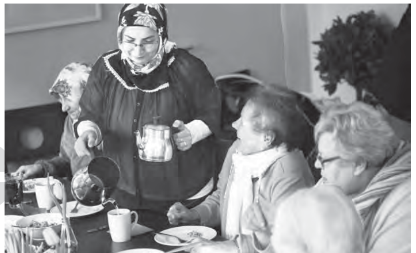
Eines der vielen Angebote im westend: das internationale Frauenfrühstück, das zweimal im Monat stattfindet.

Unsere Reihe zum Thema „Islam“, die in diesem Rahmen von Februar bis Juni stattfand, war besonders interessant. Wir sprachen über Mohammed, die fünf