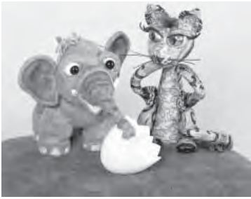
Elefant Bobo und Kätzchen Grün- auge sind Freunde. Foto: ein

fanten und Schleickatzen aus Pappe, Papier und Stoffresten.