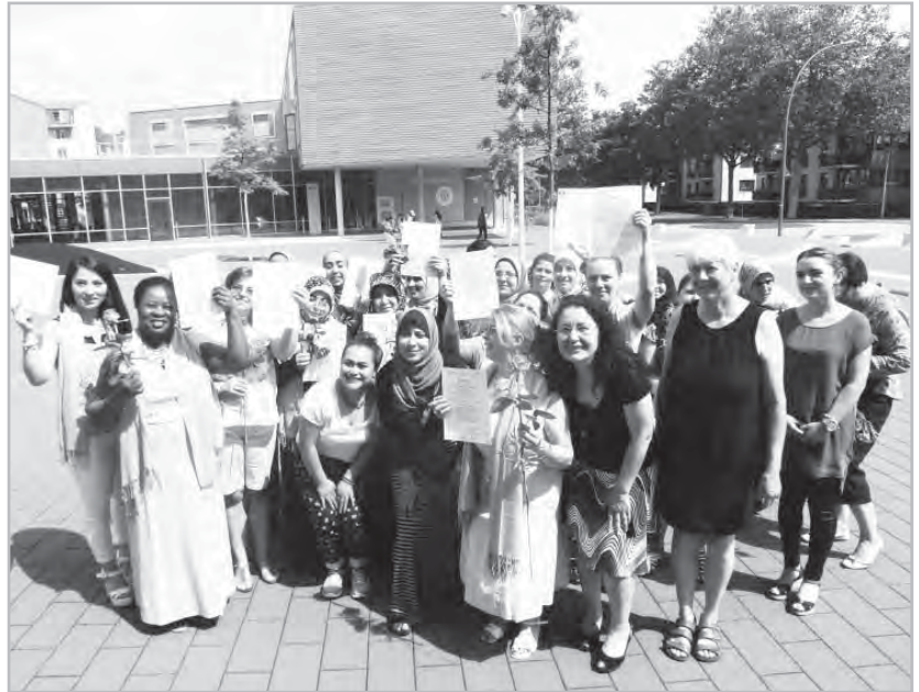
Gute Stimmung herrschte bei der Zertifikatsübergabe an die 14 neuen Inselmütter. Fürs Foto versammelten sich alle, auch die bereits tätigen Frauen und die Schulungsleiterinnen, vor dem Elternschulcafé in der Tor-zur-Welt-Schule.