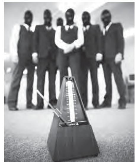
Sound of Noise.

Oder da ist „Sound of Noise“, eine Krimikomödie, in der maskierte Gestalten die Bank nicht wegen des Geldes, sondern wegen der Musik überfallen. Formulare werden im Takt gestempelt und Geldscheine geschreddert. Ein Rätsel tut sich auf für den schwedischen Kommissar und Musikkasser Amadeus Warnebring, der die „Musikterroristen“ durch die