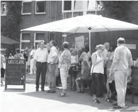
Am Krankenhaus Groß-Sand fand ein kulturell-kulinarisches Sommerfest statt.