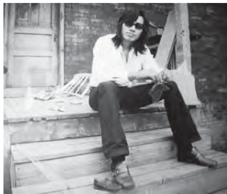
Searching for Sugarman.

PM. Auch in diesem Jahr können sich die Elbinsulaner freuen: Wieder einmal gibt es Kinoprogramm vom Feinsten unter freiem Himmel an einem feinen, verwunschenen Ort. Ganz in der Nähe des Auswanderermuseums Ballinstadt an der S-Bahn Veddel zeigen Insellichtspiele e.V. in der „Ateliergemeinschaft Elbinsel Kunst“ an zwei Wochenenden im August Filme zum Thema Musik. Filme, in denen Musik nicht nur den prägenden Soundtrack bildet. Sondern in denen Musik explizit die Hauptrolle spielt.