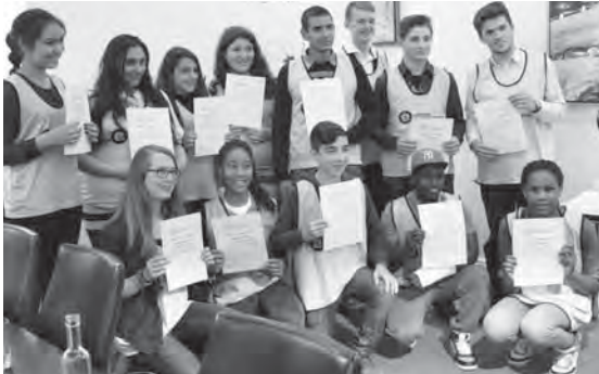
Die Ferienchefinnen und -chefs des letzten Jahres bei der Abschlusspräsentation in der Handelskammer.

Das etwas andere Ferienprogramm in Kooperation mit der Stadtteilschule Wilhelmsburg